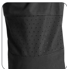
větrání v zadní kolenní části ventilation on back knee part wentylacja z tyłu kolan